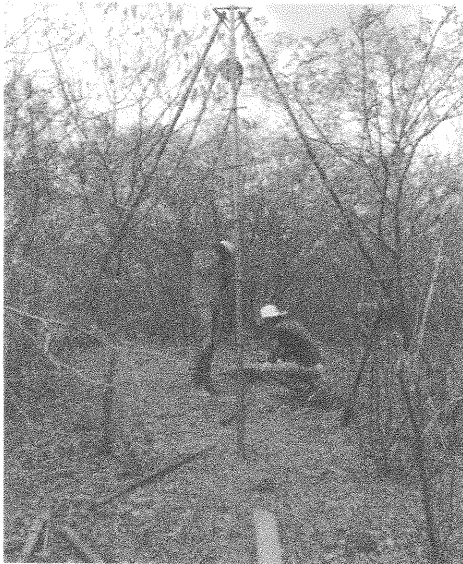
SERVIÇO DE SONDAGEM SPT